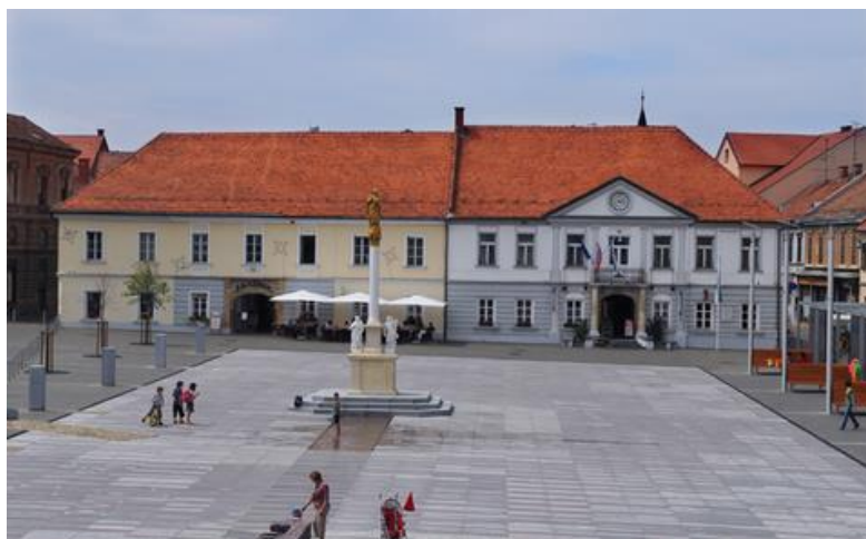
Slika 15 Mestna hiša s trgom