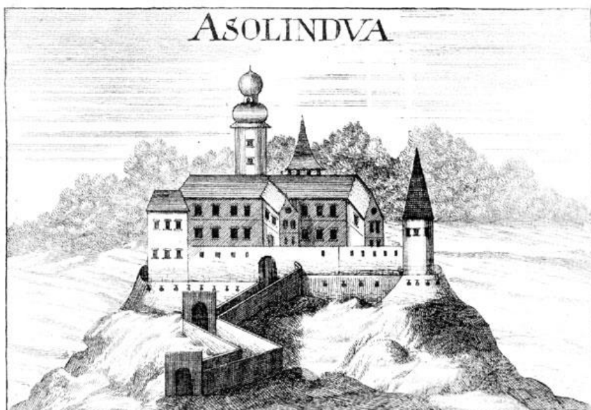
Slika 6 Lendvaski grad pred 18. Stoletjem