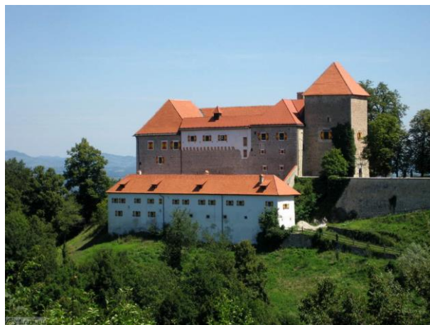
Slika 10 Grad Rotenturn danes

Grad Rotenturn, ki je bil dograjen leta 1443, je bil del mestnega obzidja. Sedanjo obliko je prejel v 18. stoletju. V preteklosti je bila v njem mestna šola. Sedaj služi kot sedež mestne občine in prireditveni prostor.