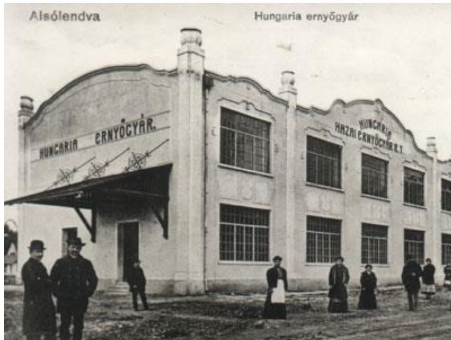
Slika 5 Dežnikarna Hungária

Po osamosvojitvi Slovenija je podjetju šlo vedno slabše in so ga leta 2001 zaprli.