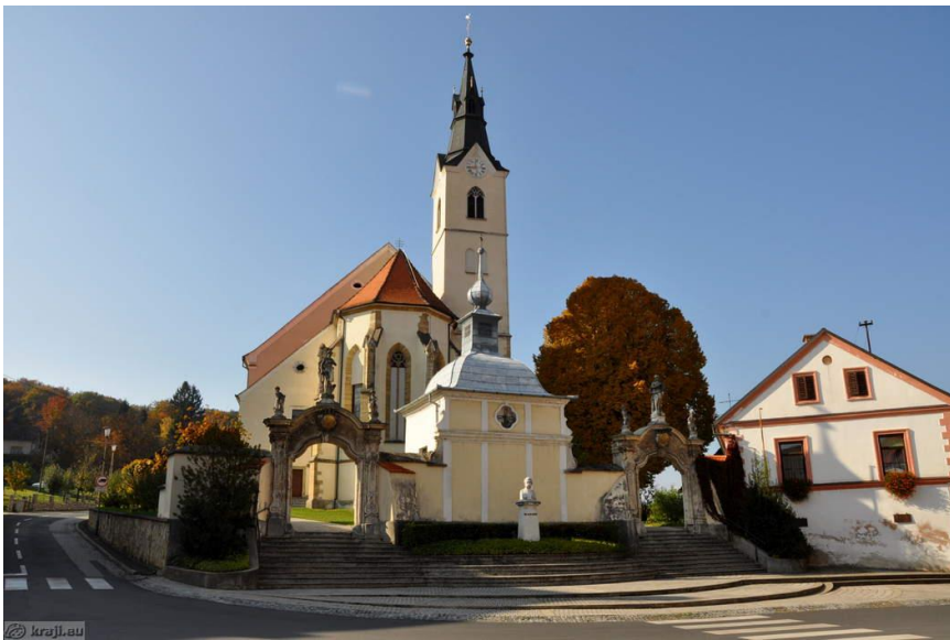
Slika 14 Cerkev danes

Cerkev predstavlja osrednji sakralni spomenik v Prlekiji. Njeno obzidje je nekoč omejevalo tudi pokopališče. Pokopališče so v 18. in 17. stoletju premaknili, del obzidja so porušili. Ohranila sta se le dva portala in Florijanova kapela, ki se nahaja med obema portaloma. Kipi in celotna arhitektura predstavljata izreden in kvaliteten baročni slog. Cerkev pa je potrebna obnove.