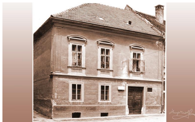
Slika 11 Rojsta hiša Huga Wolfa

Hugo Wolf je bil slovenski skladatelj, ki je deloval v 19. stoletju. Njegova rojstna hiša je sprva bila glasbena šola, sedaj je preurejene v muzej.