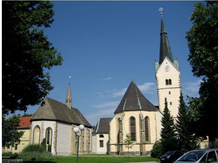
Slika 12 Cerkev danes

Cerkev sv. Elizabete je najstarejša glasba v mestu Slovenj Gradec. Posvečena je Elizabeti Ogrski, ki je bila redovnica in grofica. Od prvotne zgradbe se je ohranilo le nekaj delov, saj so jo v obdobju gotike renesanse in baroka obnovili.