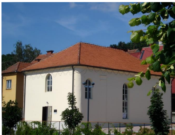
Slika 1 Lendavska sinagoga

Ker je lendavska sinagoga ob mariborski edina ohranjena v Sloveniji, je njen pomen še toliko večji. Menim, da je njena vloga tudi danes velika, saj v njej prirejajo veliko različnih prireditev. Seveda pa nam služi tudi kot spomin na kulturno in duhovno dediščino Lendave ter na nekdanje judovsko prebivalstvo, ki je imelo izredno velik vpliv na Lendavo. Judje so zasedali izredno visoke položaje v Lendavi npr. zdravniške, odvetniške, obrtniške, lastniške.