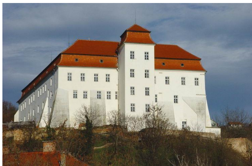
Slika 7 Grad danes