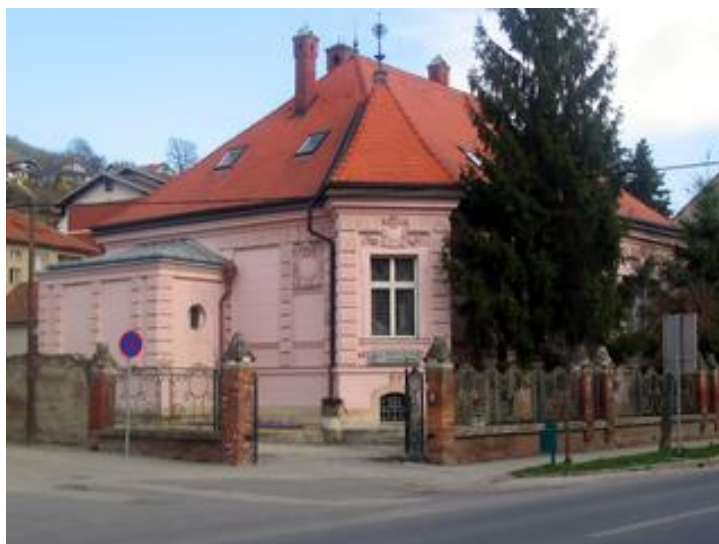
Slika 3 Vila danes kot mestna knjižnica Lendava