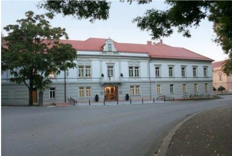
Slika 4 Mestna hiša danes