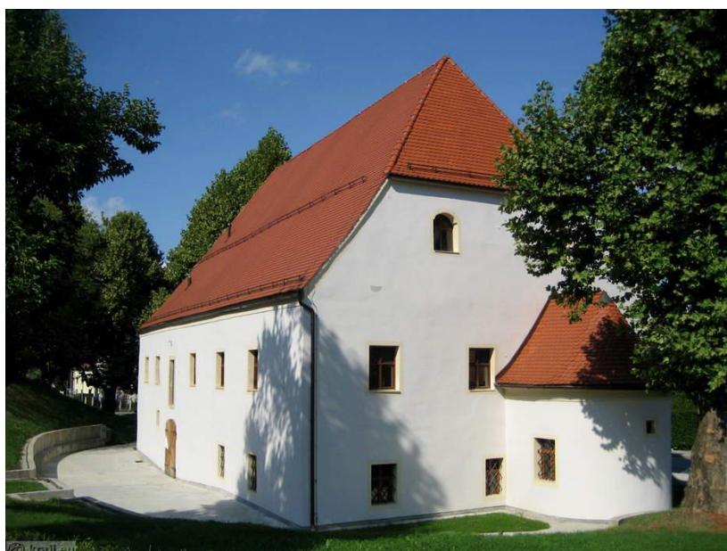
Slika 16 Ljutomerski špital

Leta 1837 so v Ljutomeru dobili špital, ki je bil zgrajen v zdravstvene namene, lociran ob ljutomerski cerkveni hrib in dovolj kakovosten za bolnišnične potrebe. Ob izboljšanju zdravstva so to vlogo stavbe premestili drugam. Špital je tako postal Ljutomerska klet. Danes je stavba že dokaj zapuščena, v objektu pa so tudi stanovanja.